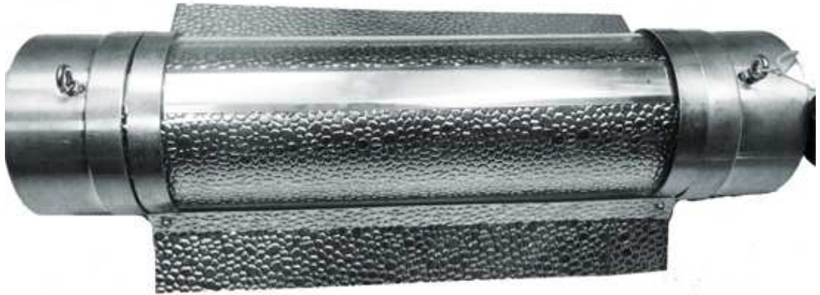
Tubo con las alas montadas