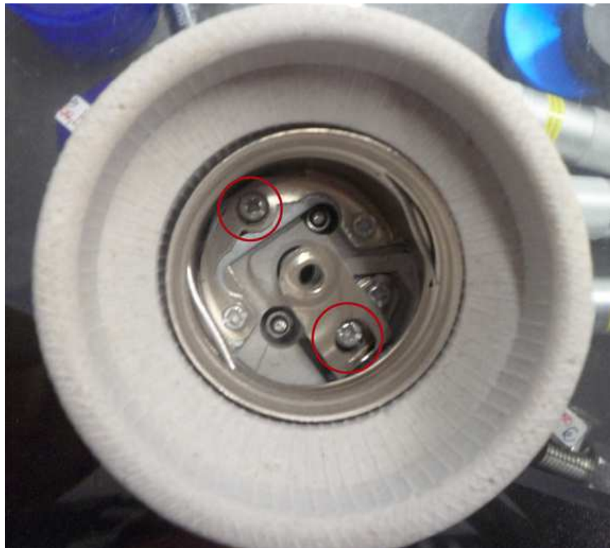
Tornillos que debemos aflojar al meter la mano por el tubo