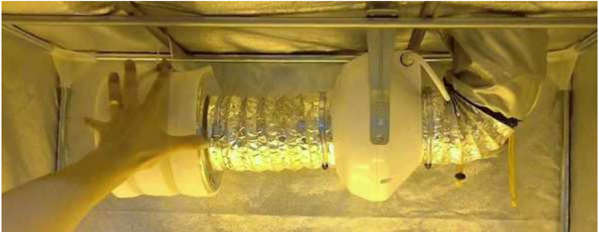
10. Ejemplo conexión extractor y filtro dentro del armario

Si lo ponemos fuera del armario lo podemos colgar del techo o de la pared con unos soportes. Debemos poner un tubo de 102 mm desde el extractor hasta una boca superior del armario que irá hasta el filtro y otro tubo desde el extractor hacia el exterior.