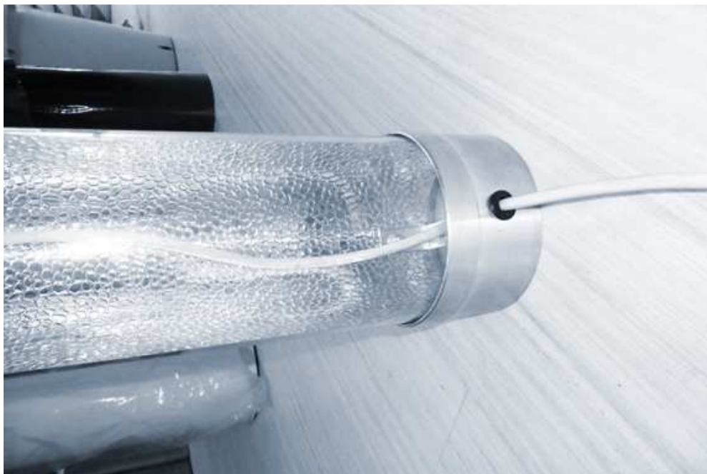
Agujero por donde pasamos el cable