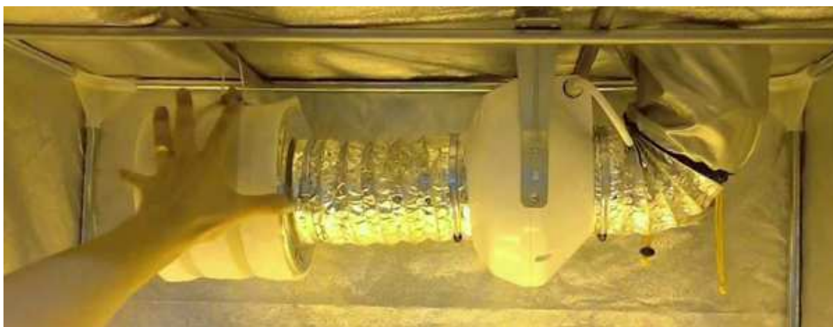
10. Ejemplo conexión extractor y filtro dentro del armario

Si lo ponemos dentro del armario deberemos colgarlo de las barras superiores del armario con las cintas de velcro que trae el armario, con poleas, con cuerdas, cadenas o con los propios soportes que trae el extractor. Deberemos conectar un tubo de aluminio flexible de 102 mm que vienen con el kit y llevarlo por una salida superior del armario hasta el exterior, normalmente una ventana. El extractor y el filtro se pueden conectar entre si directamente, asegurando la conexión con cinta americana o bridas o mediante un trozo de tubo de 102 mm, asegurado también con bridas o cinta americana